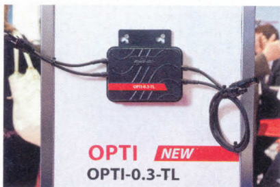
Mittlerweile bieten auch konventionelle Wechselrichterhersteller wie Power-One Inc. Leistungsoptimierer an

Dass sich schon kleine Teilschatten von Antenne und Schornstein auf den Ertrag verhältnismäßig stark auswirken, hängt mit dem Konstruktionsprinzip von Modulen und Solargeneratoren zusammen. Sowohl die Zellen innerhalb eines Moduls als auch die einzelnen Module innerhalb einer Anlage sind in den meisten Fällen in Reihe geschaltet. Während sich die Spannungen addieren, wird der Strom von der schwächsten Zelle beziehungsweise vom schwächsten Modul bestimmt. Genau dieses Phänomen machen sich Leistungsoptimierer zu nutze. Ihre Elektronik ist in der Lage, den Strom der verschatteten Anlagenteile so weit zu erhöhen, dass er dem der anderen Module entspricht – der Flaschenhals ist beseitigt. Daneben gibt es Geräte, die das gleiche Ziel mit einer anderen Methode erreichen wollen. Sie stellen in einem